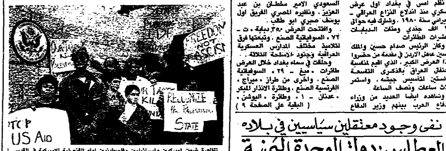
تقارعة ضمت اميركيين واسرائيليين فلسطينيين امام القنصالية اميركية في القدس المحتلة احتجاجا على اعمل القبع الاسرائيلية